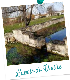
Lavoir de Viville