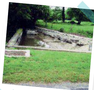
le lavoir des Bouillons